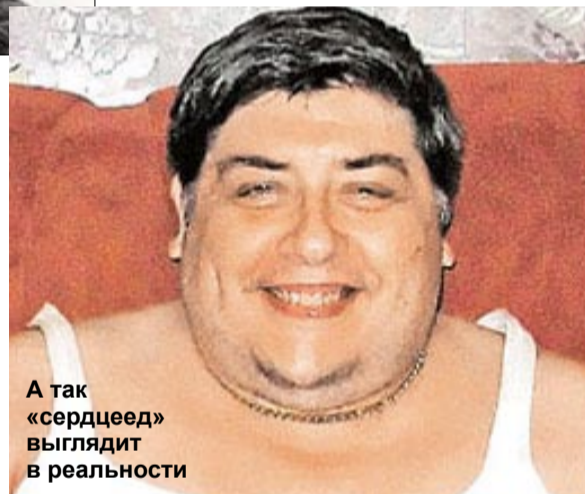
А так «сердцеда» выглядит в реальности

Доверчивые одинокие тётки, хитрый безжалостный аферист... Возможно, ситуация была бы обычной, если бы не внешность Даналиса! Я уже привыкла к историям о 20-летних арабах и турках, которые с помощью карамельного личика и пары заученных фраз про любовь до нитки обирают русских барышень. Тут хотя бы проглядывает вечный мотив: «За любовь молодого красавца нужно платить». Но я гляжу на фото Иоан-