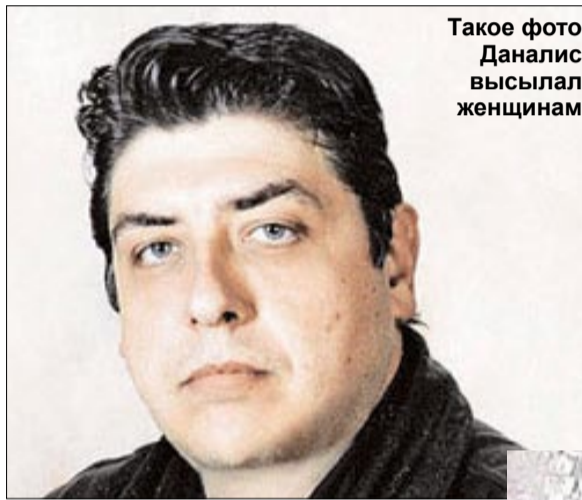
Такое фото Даналис высылал женщинам

Российский банк в помощи отказал, греческая турфирма тем более... Навстречу пошёл сайт знакомств, где женщина познакомилась с жуликом. Администраторы сайта